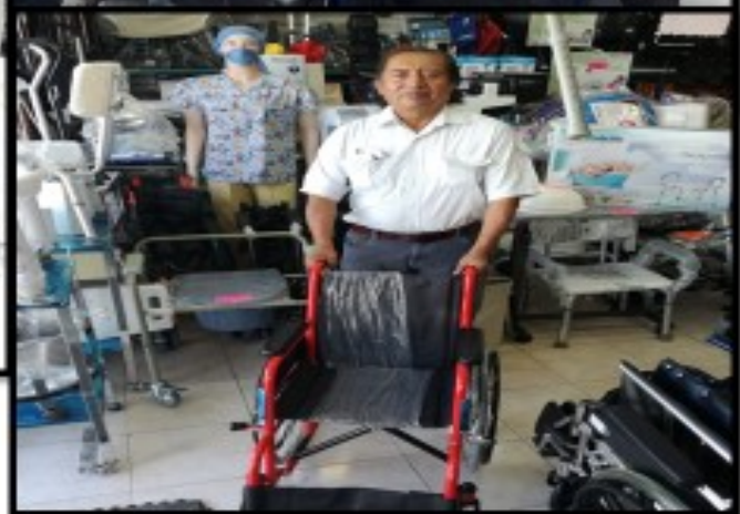
Comisión de Industria, Comercio y Asuntos Agropecuarios