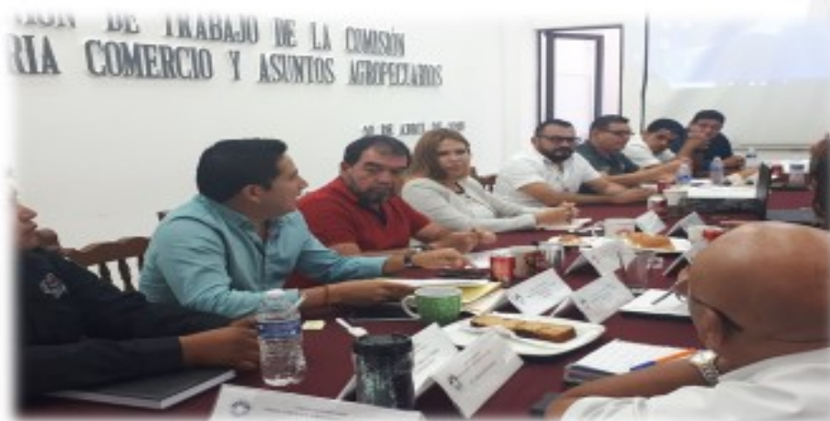
Comisión de Industria, Comercio y Asuntos Agropecuarios