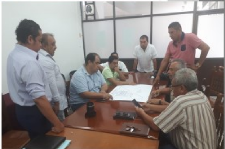
REUNION CON MURALISTAS