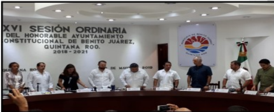
Comisión de Industria, Comercio Y Asuntos Agropecuarios

*Se aprobó por unanimidad reformar diversos artículos del Reglamento de Construcción para el Municipio de Benito Juárez, Quintana Roo.