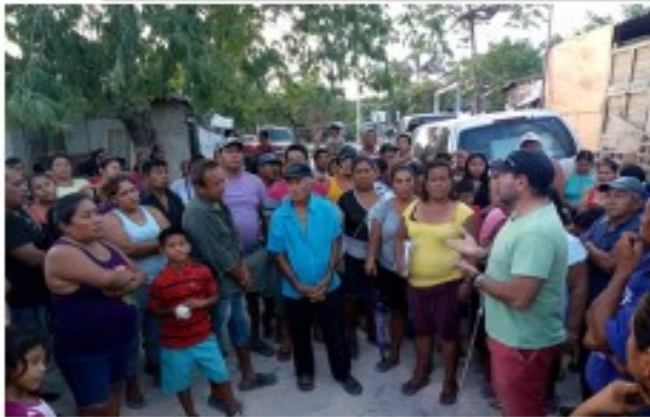
Comisión de Industria, Comercio y Asuntos Agropecuarios