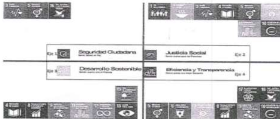
Relación de los Programas derivados del Plan Municipal de Desarrollo 2018-2021 y su vinculación con Organismos Centralizados y Descentralizados.

En cumplimiento al Artículo 56 de la Ley de Planeación para el Desarrollo del Estado de Quintana Roo, última reforma publicada en el Periódico Oficial del Estado el 04 de noviembre de 2020, los Programas derivados del Plan Municipal de Desarrollo 2018-2021 de acuerdo a su ámbito de aplicación se clasificaron en: