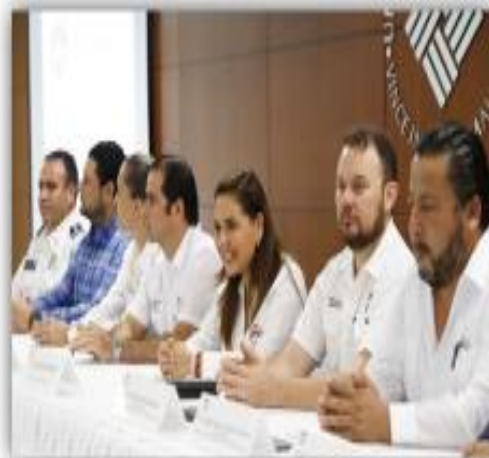
PLAN DE TRABAJO DIR. ASUNTOS RELIGIOSOS