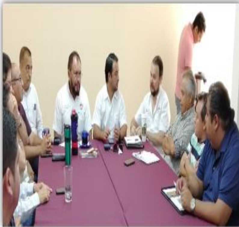
Reunión de la Comisión de Desarrollo Urbano y Transporte con el Director de Tránsito Municipal y Abogados de la Dirección de Asuntos Jurídicos del H. Ayuntamiento de Benito Juárez, Quintana Roo.