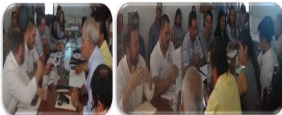
PRECABILDO 9 DE ENERO