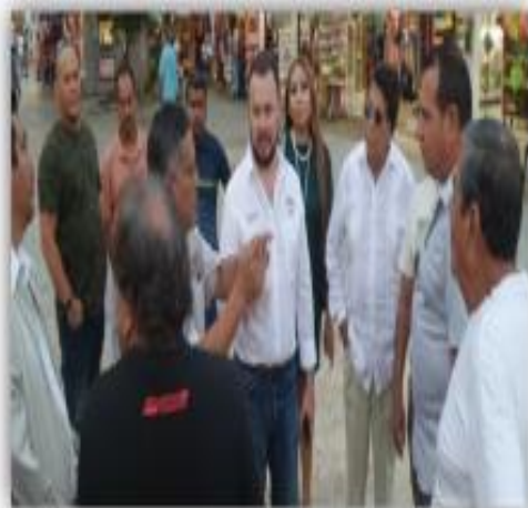
ATENCIÓN A LOCATARIOS DEL MERCADO KI-UIC