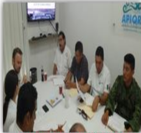
INFORME ANUAL APIQROO