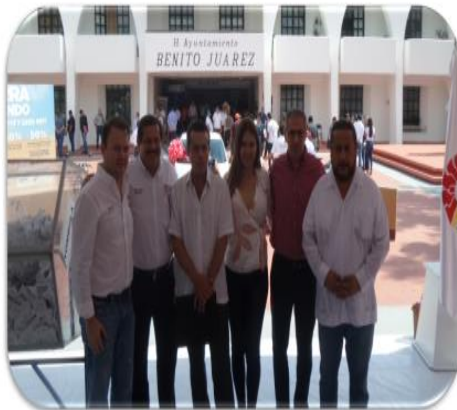
SORTEO DE PREDIAL, ENERO 2019