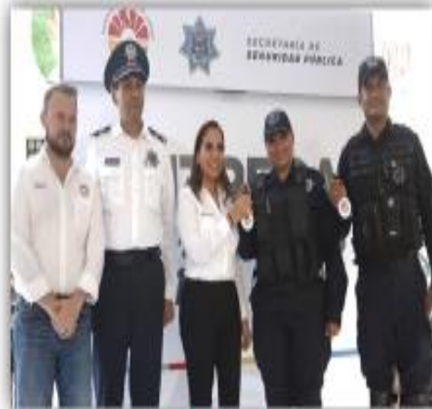
ENTREGA DE PATRULLAS ZONA CENTRO