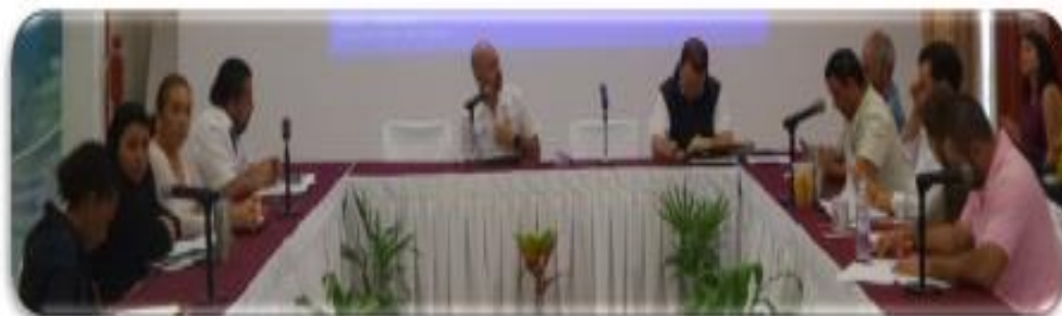
21 DE ENERO