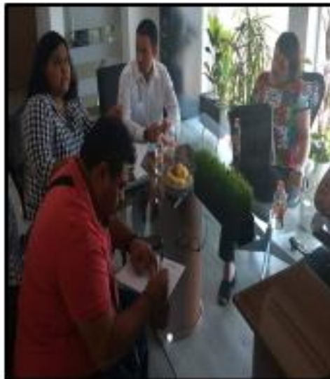
Reunión de la Comisión de Desarrollo Urbano y Transporte, con los Empresarios de las Grúas donde se abordó el tema de los tabuladores de precios para llegar a un mutuo acuerdo.