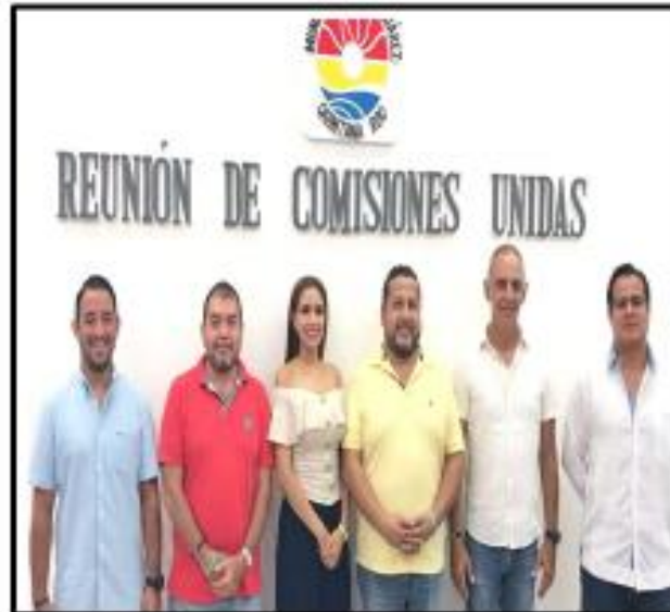
Comisiones Unidas en las que analizamos y atendimos diferentes iniciativas.