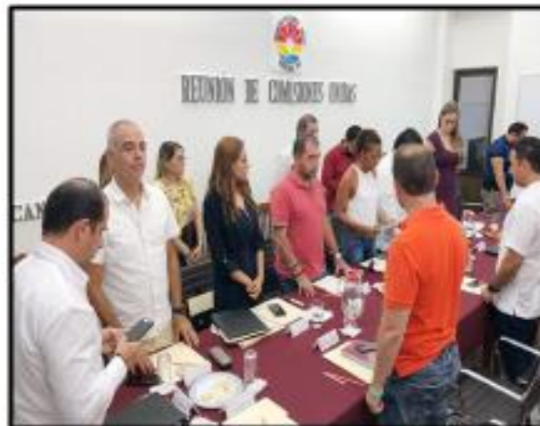
Reunión de las comisiones de Seguridad Pública, Policía Preventiva y Tránsito, Régimen Interior y Educación, Cultura y Deporte, para analizar las iniciativas turnadas.