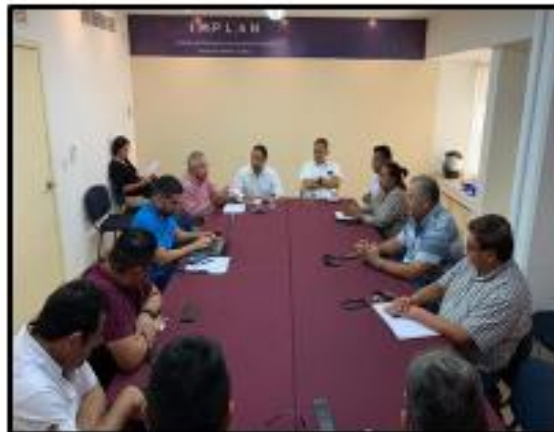
Reunión de la Comisión de Desarrollo Urbano y Transporte, con concesionarios de Transporte Público Estatal, donde se abordaron temas sobre el servicio del Transporte Público y como poder dar un mejor servicio.