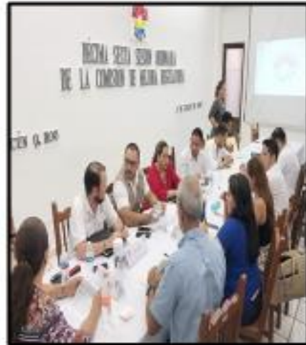
Decima sesión ordinaria de la comisión Mejora Regulatoria.