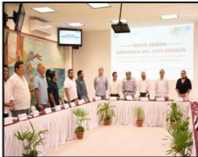
Sexta Sesión Ordinaria del COPLADEMUN en la cual se analizaron las propuestas de modificación de programa de inversión Anual y en su caso Aprobación.