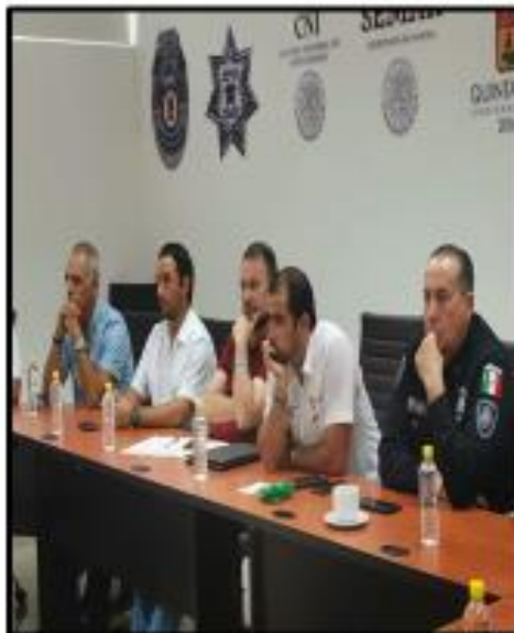
Estuve Presente en la Reunión "Avances de las estrategias de prevención" encabezado por la Secretaria de Seguridad Publica.