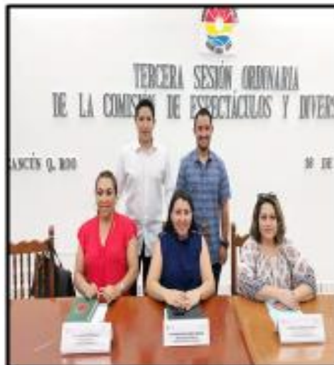
Tercera Sesión Ordinaria de la Comisión de Espectáculos y Diversiones.